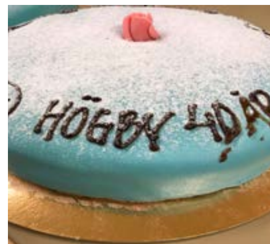
Vallonbygden bjöd på tårta till alla boende som var med och firade Högby 40 år.